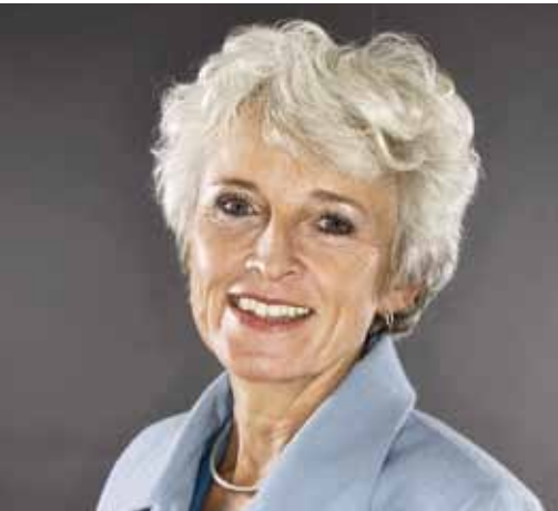
Jacqueline Cramer Minister van Volkshuisvesting, Ruimtelijke Ordening en Milieubeheer